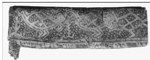
Берестяные ножны с изображением трех глухарок (эпоха средневековья). Войкарский городок