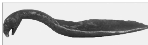
Ложка с изображением головы хищной птицы на рукояти (кость), Усть-Полуй, I в. до н.э.

тов). Третья группа задач направлена в конечном счете на более успешное решение двух первых.