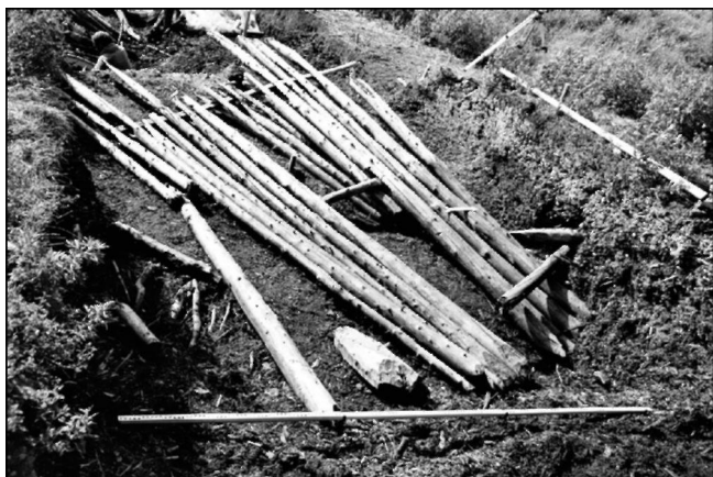
Фрагмент деревянного частокола XV века. Войкарский городок

тия традиционной экономики и культуры у коренных малочисленных народов циркумполярной зоны планеты.