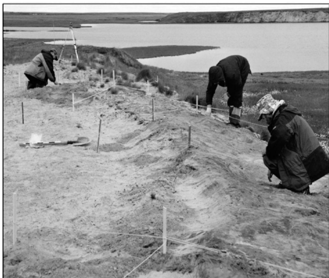
На раскопках средневековой стоянки Юнета-яха III. 2006 г.

Первое направление: древнее святилище Усть-Полуй. Исследования археологического памятника, имеющего сложное наименование «городище (жертвенное место) Усть-Полуй», ведутся си-